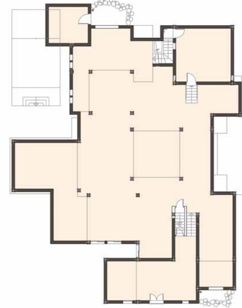
Basement Planta Sótano