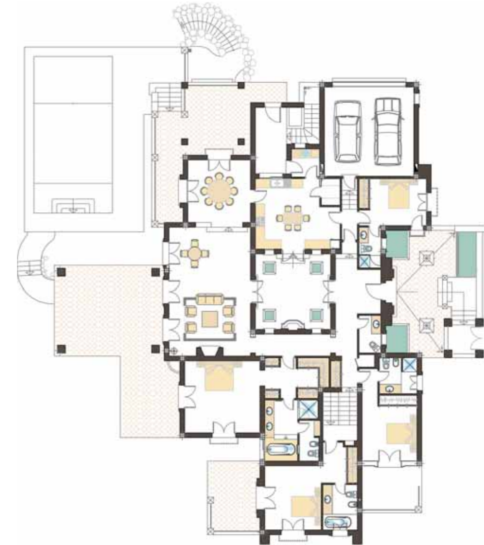
Ground Floor Planta Baja